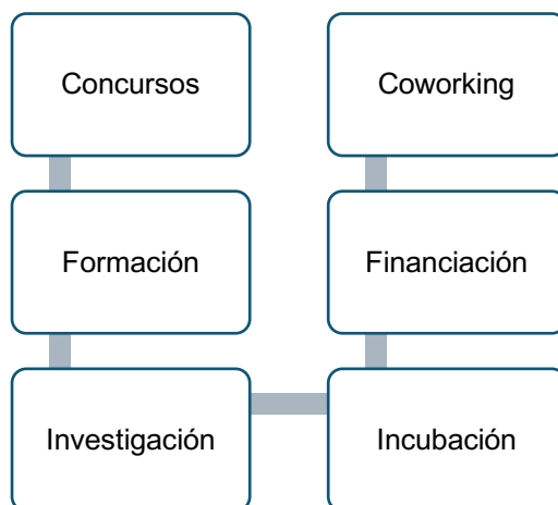
Gráfico 3. Actividades principales desarrolladas por las antenas de innovación social en LATAM