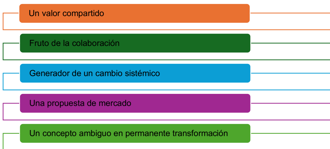
Gráfico 1. Tendencias clave basadas en el enfoque que aportan a las definiciones de innovación social

Entre las múltiples definiciones de Innovación Social surgidas en la última década, se pueden identificar algunas tendencias clave en cuanto a su enfoque, Gráfico 1: