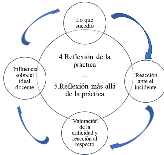
Gráfico 2. Incorporación del esquema de Alvarado, Neira y Westmacot